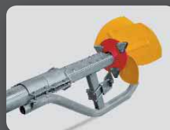
Hacheur haute performance avec contre-couteau