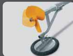
Pied de protection avec fixation pneu