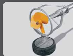
Anneau de protection d'hélice avec fixation de pneu pour fosses en géomembrane