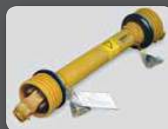
Cardan 1" 3/4 côté machine