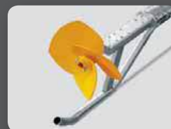
Pied de protection long