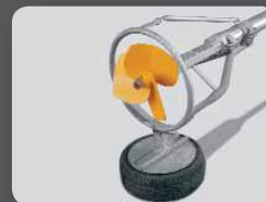
Anneau de protection d'hélice avec fixation de pneu pour fosses en géomembrane