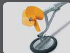
Pied de protection avec fixation pneu