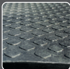
Surface GRIP incurvée Meilleure adhérence