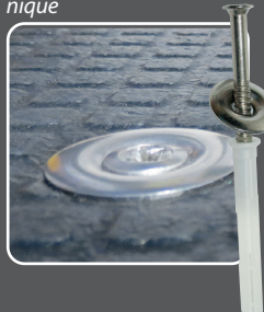
Système de fixation éprouvé Kraiburg

Extrêmement solide, arrondi et à fleur du tapis