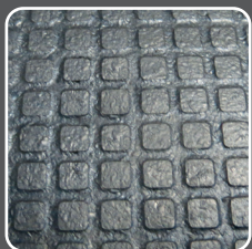
Surface quadrangle Anti dérapant et hygiénique