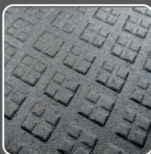
Surface inférieure Profil à carrés multiples