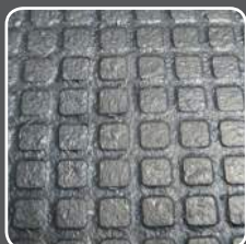
Surface quadrangle Anti dérapant et hygiénique