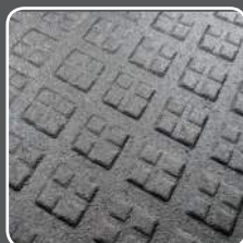
Surface inférieure Profil à carrés multiples