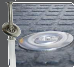
Système de fixation éprouvé Kraiburg

Extrêmement solide, arrondi et à fleur du tapis